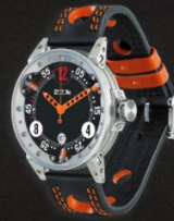
— V6 SA

La GF6 et GF7, seules montres automatiques du monde avec lesquelles vous pouvez jouer au golf. Le mouvement suspendu par six amortisseurs et la masse anti-emballement garantissent au joueur une frappe debout sans destruction du mouvement.