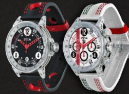
V6 et V12 —

La RG46, la montre de toutes les innovations. Ce garde-temps est doté d'un mouvement exclusif suspendu sur trois amortisseurs et trois vérins verticaux, d'un rotor monté sur des billes en céramique et d'une masse autobloquante brevetée.