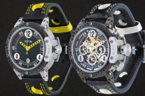
— DDF6 et DDF12

La V6 SA, SA pour shock absorber, la première montre au monde dont le mouvement suspendu par trois amortisseurs semi-couchés vous permet de piloter sans contraintes.