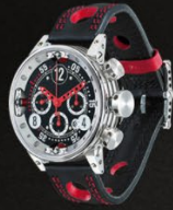
— V12 SA —

La V12 SA, sa structure en trois parties forme un sandwich inox-titane-inox. La construction unique de cette montre chronographe, grande sœur de la V6 SA, permet aux pilotes d'affronter une course de 24 heures ou un grand prix en toute sérénité.