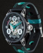
V6 Triplette —

La Birotor, première montre du marché à être équipée de sept verres et à offrir une vue sur les six faces.