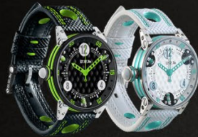
— GF6 et GF7 —

La V12 SA, sa structure en trois parties forme un sandwich inox-titane-inox. La construction unique de cette montre chronographe, grande sœur de la V6 SA, permet aux pilotes d'affronter une course de 24 heures ou un grand prix en toute sérénité.